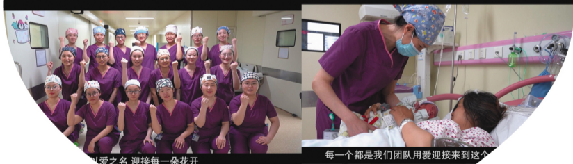
以爱之名 迎接每一朵花开